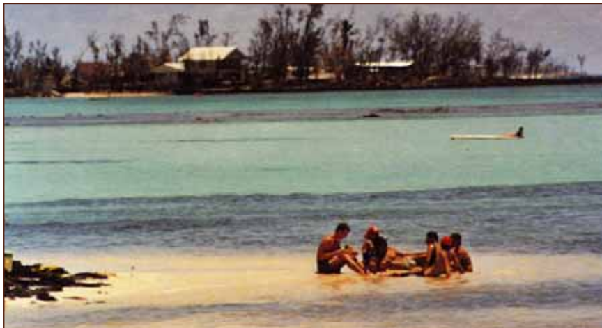
Viele Bewohner auf Mauritius haben mit Woodoo zu tun. Sie opfern Hühner und Hunde für die Geister. Der Tourist merkt davon kaum etwas.

mich eingezogen. Aber ich habe immer noch die Wahl, mich von Gott abzuwenden. Deshalb warten die Dämonen noch. Ich wusste damals noch nicht, wie ich mich davor schützen konnte, weil ich die Bibel nicht kannte. Aber sie hassen das Licht. Die meisten Gewalttaten geschehen in der Nacht, unter der Macht der Finsternis. Kinder haben es oft lieber, bei Licht einzuschlafen, weil sie vor der Dunkelheit Angst haben.