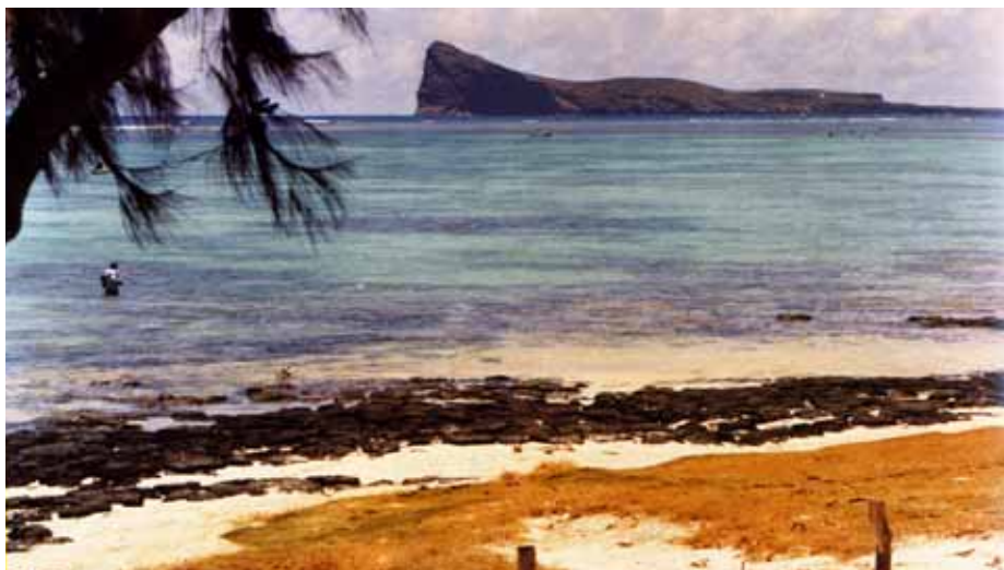
Einer der vielen schöne Strände auf Mauritius

war. Sie hatte mir immer wieder gesagt, „wenn du irgendein ernstes Problem hast, dann rufe nach Gott.“ Da ich nicht wusste, was ich sagen sollte, schrie ich einfach im Herzen: „Gott, wenn es dich wirklich gibt, dann hilf mir beten.“ Sofort kam mir das „Vaterunser“ in den Sinn. Zum ersten Mal betete ich wirklich aus ganzem Herzen und bat Jesus Christus, mein Leben in die Hand zu nehmen. „Vergib mir, wie ich meinen Schuldern vergebe...“ Mir war auch sofort bewusst, dass ich dem indischen Taxifahrer und dem chinesischen Hotelier verzeihen musste.